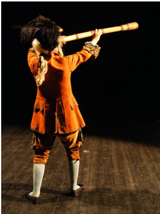
Le Baron de Münchhausen – Kairos théâtre